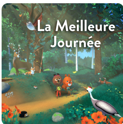
La Meilleure Journée