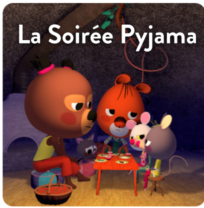
La Soirée Pyjama

Hortense et Polka invitent Edmond, Lucy et Mitzi à une soirée pyjama. Malgré une super organisation, l'évènement dégénère... il faut dire que les Souris aiment bien tout contrôler. Et s'il suffisait de mettre en commun les envies de chacun pour passer une soirée mémorable ?