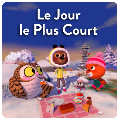
Le Jour le Plus Court

En plein hiver, Edmond et Lucy pestent contre les journées qui sont si courtes. Si seulement ils pouvaient se débrouiller pour allonger le jour... Surtout qu'aujourd'hui c'est le plus court de l'année!